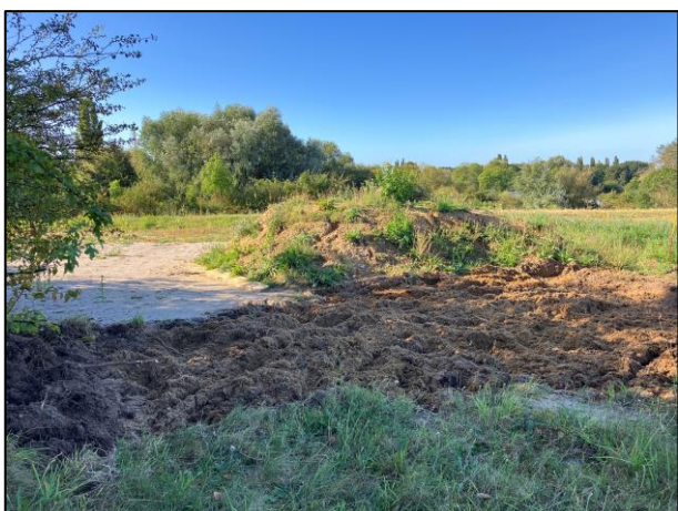
Nach dem Abziehen und Aufreißen der Fläche

Ab Oktober fangen unsere Arbeitseinsätze wieder eine Stunde später an von 10:15-13:15.