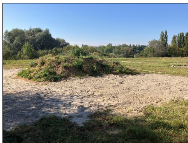
Fertig durchgearbeitete und verfüllte Fläche