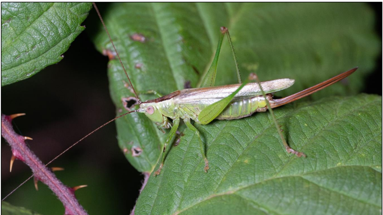
„Beifang“ auf der Suche nach dem Weinhähnchen: Weibchen: Weibchen der Langflügeligen Schwertschrecke

Im Spätsommer und Frühherbst stand im Projekt die Nachsuche einiger Arten an. Insgesamt konnten wir auf der Fläche in Steinwerder etwa 20 stridulierende Männchen des Weinhähnchens ( Oecanthus pellucens ) feststellen und somit das seit 2019 bekannte Vorkommen bestätigen. Nicht bestätigt werden konnte hingegen das dort 2021 und 2022 festgestellte Vorkommen der Italienischen Schönschrecke ( Calliptamus italicus ). Stattdessen konnte hier im August dieses Jahres der Erstdnachweis der Langflügeligen Schwertschrecke ( Conocephalus discolor ) für Hamburg erbracht werden. Das seit 2022 in Altenwerder bekannte Vorkommen des Weinhähnchens konnten wir mit 3 stridulierenden Männchen erneut bestätigen.