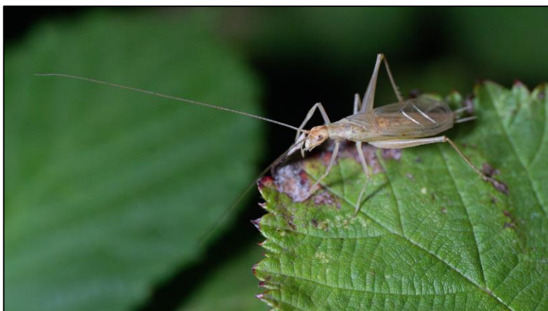
Im Licht der Taschenlampe legt das Weinhähnchen eine „Gesangspause“ ein

Das sommerliche vorletzte Wochenende im September bescherte uns beste Bedingungen für die Suche nach singfreudigen nachtaktiven Weinhähnchen ( Oecanthus pellucens ). Ursprünglich aus dem Mittelmeerraum stammend, hat diese Langfühlerschrecke ihren Weg mittlerweile auch bis zu uns in den Norden gefunden. Die Gesangsrolle wird dabei von den stridulierenden Männchen übernommen, um Weibchen anzulocken. Mit gespitzten Ohren begaben wir uns gegen Abend an verschiedenen Orten rund um das Hamburger Hafengelände auf die Suche. Auf einer Ruderalfläche in Steinwerder wurden wir von einem regelrechten Weinhähnchen-Konzert empfangen. Aber auch weiter südwestlich in Altenwerder wurden wir fündig. Trotz der zarten Größe und Statur der Weinhähnchen ist der Gesang der Männchen verhältnismäßig laut und dadurch über einen relativ weiten Bereich zu hören. Dies ermöglichte uns, das ein oder andere Weinhähnchen akustisch aufzuspüren und beim Singen beobachten zu können. Dabei werden die Vorderflügel senkrecht zum Körper aufgestellt und mit hoher Frequenz aneinandergerieben, was den charakteristischen Gesang erzeugt. Meist wurde das Konzert von einem Brombeerblatt aus vorgetragen. Wie schön, einmal live dabei gewesen zu sein!