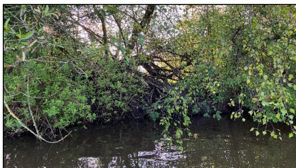
Gut versteckte Biberburg

Doch kaum waren wir wieder auf dem Heimweg kam der Biber an unserer Einstiegstelle an Land, um zu fressen. Dies belegte die Aufnahme einer Wildtierkamera.