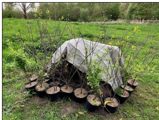
Ein Teil der neuen Sträucher

In Randbereichen vom Golfplatz haben wir 130 heimische Sträucher gepflanzt, wie beispielsweise Schlehen ( Prunus spinosa ), Heckenkirschen ( Lonicera xylosteum ) und Faulbäume ( Rhamnus frangula ). Somit können hier kleine und natürliche, wilde Ecken entstehen. Wir sind nun sehr gespannt, wie sich die