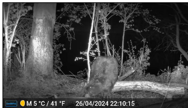
Nach der Abfahrt kam der Biber