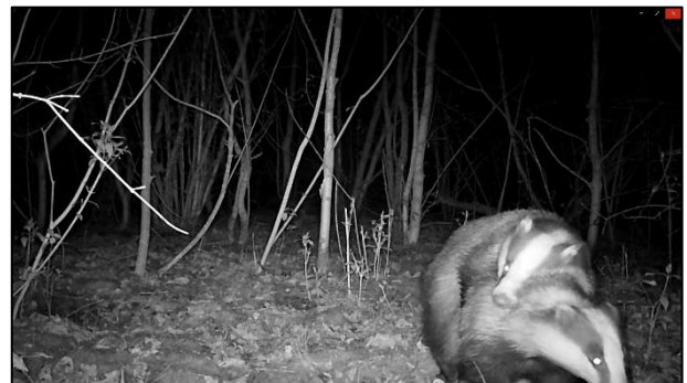
...bei den Dachsen ( Meles meles )

Außerdem haben wir einen ersten Bereich unserer Fläche gemäht. Durch die frühe Mahd werden Gräser an der Ausbreitung gehindert und Kräuter gefördert.