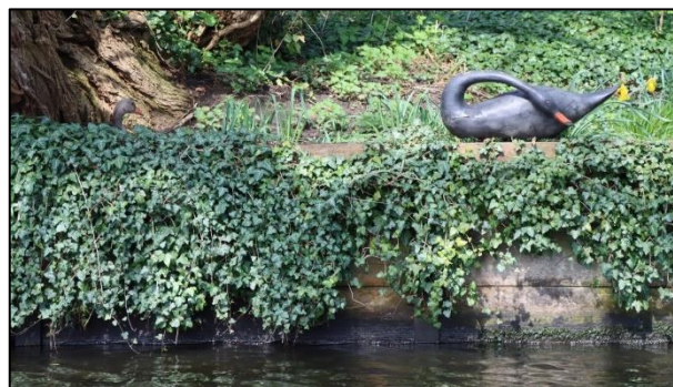
Wo sitzt der echte Vogel?