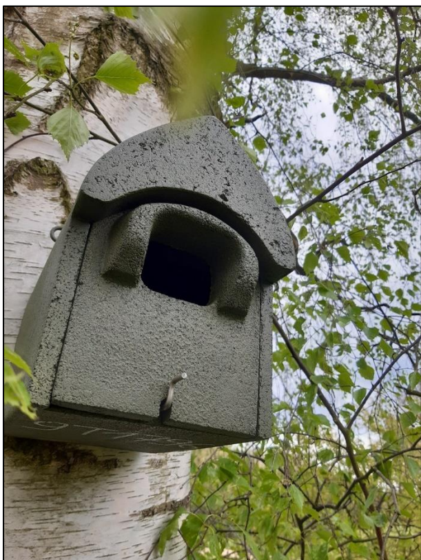
Nistkasten u.a. für Gartenrotschwänze

Sträucher entwickeln und welche Vögel in den Nistkästen brüten.