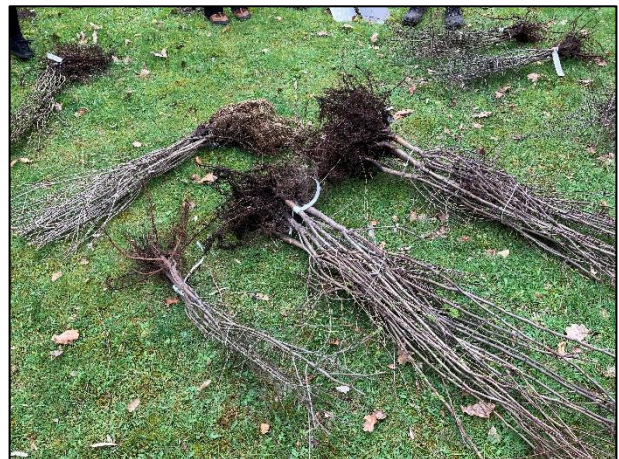
Sträucher zum Einpflanzen

Zurzeit wachsen auf dem Ohlsdorfer Friedhof hauptsächlich Rhododendren, welche zur Blütezeit zwar was für das Auge sind, aber die heimische Artenvielfalt nicht fördern. Durch diverse Umstrukturierungen auf dem Friedhof bekam der Neuntöter e.V. die Möglichkeit an 2 unterschiedlichen Standorten Hecken aus heimischen Sträuchern anzulegen. Im sonnigen und trockenen Bereich wurde u.a. Weißdorn und Schlehe gepflanzt und am schattigen und feuchten Standort Sträucher wie z.B. Faulbaum und Pfaffenhütchen. Mit 14 Freiwilligen konnten wir innerhalb 3 Stunden alle Pflanzen setzen.