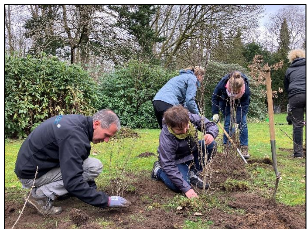
...um die neuen Sträucher einzusetzen