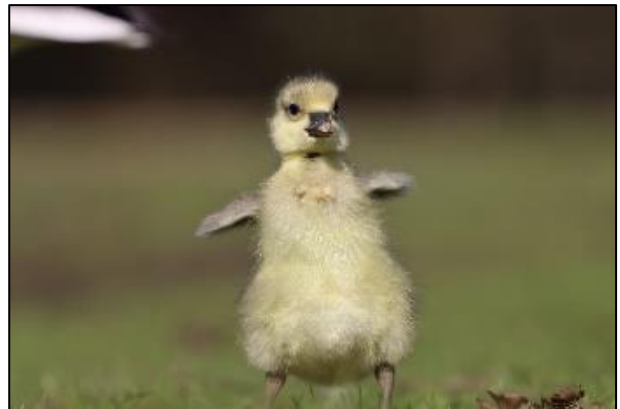
Gans klein, auf der Schnabelspitze ist noch der Eizahn

Bisher wurden fünf Familien im Stadtgebiet gemeldet.