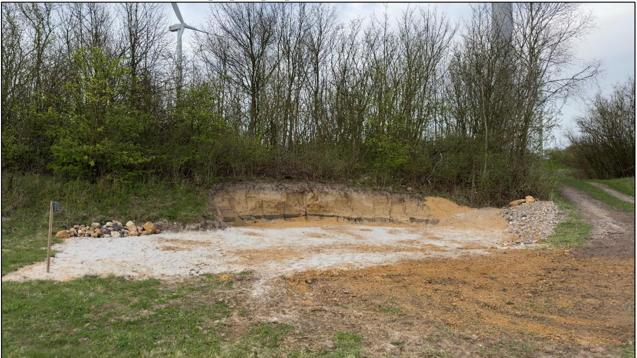
Die neue Steilwand wird direkt nach der Fertigstellung gut angenommen

Nun können wir voller Freude verkünden, dass diese pünktlich zum Saisonstart fertiggestellt wurde und die ersten Wildbienen bereits Nestgänge angelegt haben.