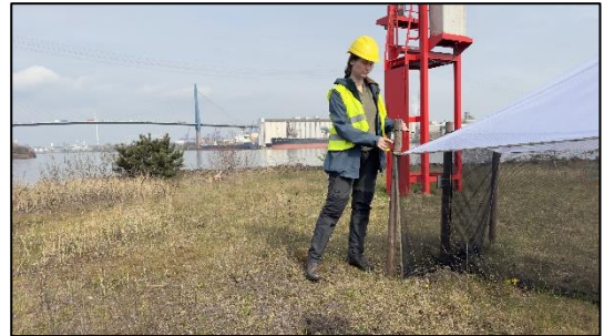
Audiorekorder-Montage am Standort Sandauhafen

Nach einem ersten Test im letzten Jahr kommen nun auch Audiorekorder im Rahmen eines ornithologischen Forschungsprojektes zu Einsatz.