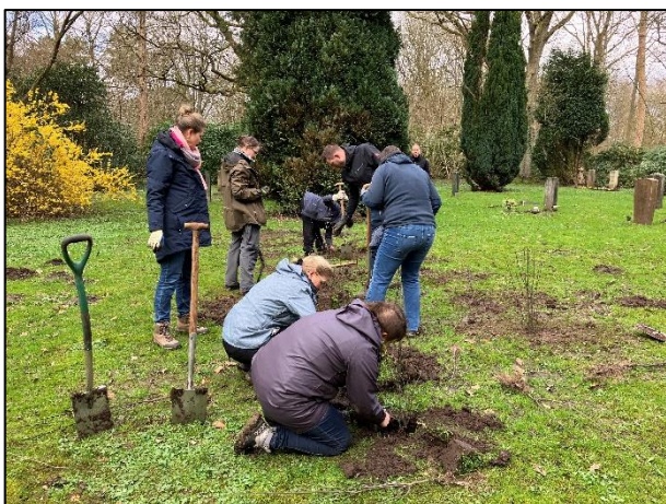
Gemeinsam wird gegraben...

Wir danken allen Helfenden für die Unterstützung.