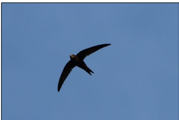
Mauersegler ( Apus apus )

In wenigen Wochen beginnt die neue Brutzeit, bis dahin planen wir noch einige Aktionen. An drei Standorten (Farmsten, Ohlsdorf, Billwerder) planen wir neue Brutmöglichkeiten für Mauersegler zu schaffen. Nistkästen für Haussperlinge wollen wir in Horn, Billwerder, Uhlenhorst und im Wildpark Schwarze Berge montieren. Ab März wollen wir drei Standorte mit heimischen Sträuchern aufwerten (Neubausiedlung Billwerder, Ohlsdorfer Friedhof). Konkrete Termine werden zeitnah festgelegt.