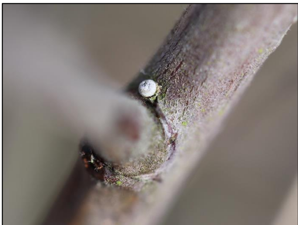
Ei des Nierenfleck-Zipfelfalters ( Thecla betulae ) (N. Kraeft)

Am 7. Januar unternahmen wir unseren Neujahres-Spaziergang auf der Deponie Georgswerder. Bei blauem Himmel und einer weißen Schneelandschaft genossen wir die Aussicht über die Stadt. Bei der anschließenden Suche nach Eiern des Nierenfleck-Zipfelfalters ( Thecla betulae ) konnten wir am Ende 9 Eier finden.