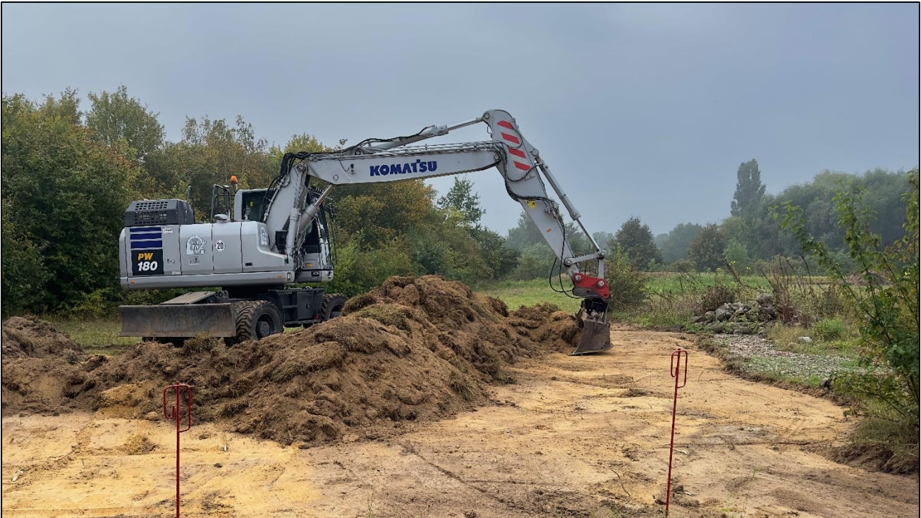
Abziehen der Grasnarbe mit dem Bagger

Der September war vollgepackt mit Aktionen. Nach Führung und Arbeitseinsatz im Rahmen von „Wildes Wilhelmsburg“ zum Monatsstart fanden am 12. September wieder Baggarbeiten auf der Projektfläche statt. Hierbei wurde wie in den Vorjahren auf etwa 300m 2 Grasnarbe samt humosem Oberboden abgezogen, um die Wiederherstellung des ehemaligen Magerrasens zu ermöglichen.