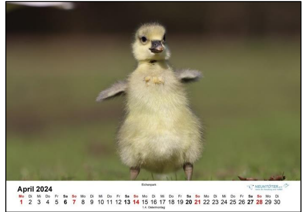
Kalenderblatt April 2024

Termine (Weitere Informationen zu unseren Terminen unter https://www.neuntoeter-ev.de/termine )