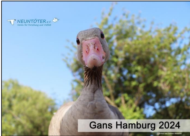
Fotokalender "Gans Hamburg 2024"

Ab Anfang Oktober ist der neue Fotokalender "Gans Hamburg 2024" (DIN A3 quer) verfügbar. Dieser Fotokalender zeigt das vielfältige Leben der Graugänse im Jahresverlauf. Mit dem Kauf unterstützt Ihr unsere Forschung und Aufklärungsarbeit im Projekt "Gans Hamburg", welche vollständig aus Spenden und dem Erlös des Kalenders finanziert wird. https://www.neuntoeter-ev.de/shop/