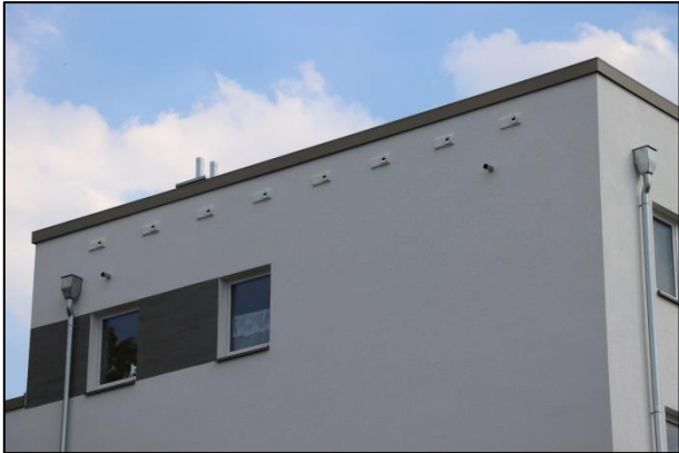
Acht neue Mauerseglerbrutplätze an einer Bramfelder Nordostfassade

Wenn wir die Möglichkeit erhalten, unterstützen wir auch andere Gebäudebrüter wie Mauersegler ( Apus apus ) und beraten bei Bauvorhaben. Im Mai wurde ein Gebäude der SAGA Unternehmensgruppe in Bramfeld fertiggestellt, bei dem zuvor u.a. Nistkästen für Mauersegler eingebaut wurden.