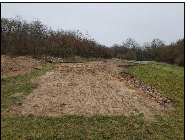
Die abgezogene Fläche wurde...

Wir bedanken uns an dieser Stelle bei allen Helfern, welche uns hierbei tatkräftig unterstützt haben.