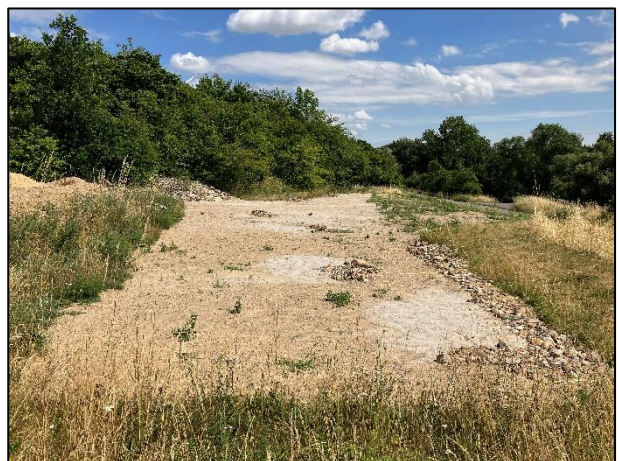
... nach vielen Arbeitsstunden fertiggestellt

Am 14.06. fand der erste, gemeinsam mit dem tatkräftig e. V. geplante, Beiersdorf Firmen-Arbeitseinsatz statt. Mit mehr als 20 motivierten Freiwilligen wurden Brombeerwurzeln aus einer zuvor abgezogenen Fläche entfernt, Pappeln und Traubenkirschen ausgegraben, getrocknete Mahd geharkt und abgefahren, sowie eine Kiesfläche von Gräsern befreit. Ein großes Dankeschön geht an alle Beteiligten. Zugleich stellte der Einsatz den Auftakt weiterer Arbeitseinsätze mit Beiersdorf dar.