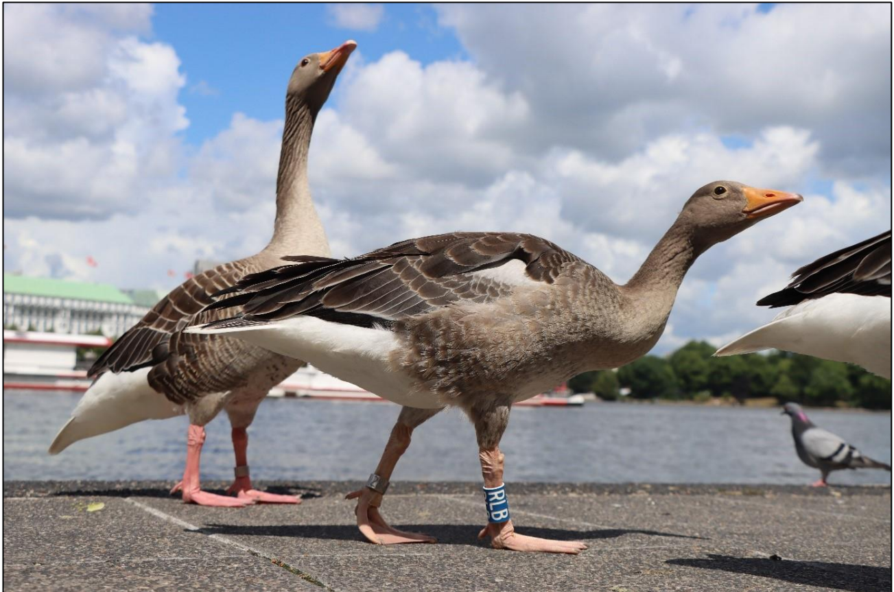
"RLB" kurz vor dem Abflug mit der Familie an der Binnenalster

Auch in diesem Jahr konnten wir wieder einige Graugansfamilien mit Ringen der Vogelwarte Helgoland markieren und so ihre spannende Lebensweise (Zugrouten, Rastplätze, Alter, Bruterfolg, Verpaarungen, Ansiedlungen etc.) verfolgen. Seit Mitte Juni verlassen die Nichtbrüter die Parks, in denen sie zuvor gemauert haben. Die Familien folgen ihnen, sobald der Nachwuchs flügge ist.