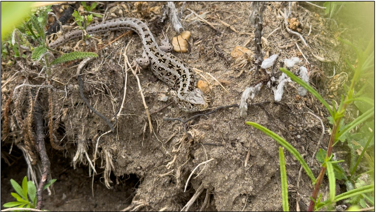
Weibchen einer Zauneidechse (Lacerta agilis)

Eine weitere schöne Beobachtung konnten wir noch am 30.06. machen. Wir entdeckten ein Weibchen einer Zauneidechse ( Lacerta agilis ) die sich gerade aufwärmte. Eine weitere konnten wir beobachten, als sie zwischen den Steinen verschwand. Für dies Jahr war dies der erste Nachweis.