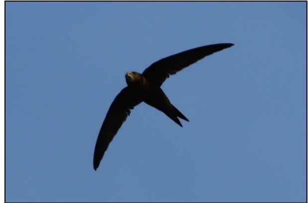
Mauersegler leiden durch Sanierungen, Abrisse alter Gebäude und mangelhafter Ausgleichsmaßnahmen zunehmend unter "Wohnungsnot"