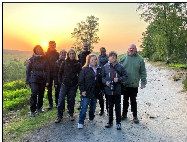
Gruppenfoto in der Fischbeker Heide

In der Dämmerung begannen die Ziegenmelker dann mit ihrem Gesang. Der Gesang hört sich ähnlich dem Balzchören der Kreuzkröte an. Dank des klaren Himmels konnten wir dann auch einige Flugbewegungen beobachten.