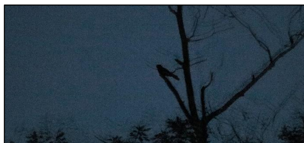
Ziegenmelker (Caprimulgus europaeus) im Baum (N. Kraeft)

Unser großes Glück war, als er sich direkt vor uns auf einem alleinstehenden Baum niederließ. So konnte man ihn noch gut in der Dämmerung erkennen. Nach 3 Stunden endete unsere Exkursion und man war einstimmig begeistert von dieser Tour und diesem wirklich beeindruckenden Vogel.