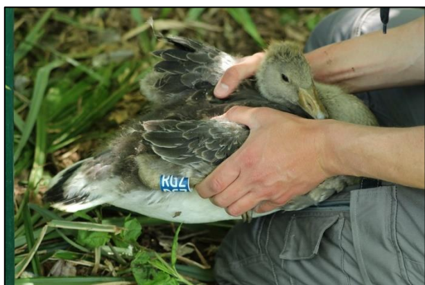
Junge Graugans "RGZ" frisch beringt (N. Kraeft)

In diesen Tagen bringen wir wieder diverse Graugansfamilien. Interessierte Leute sind herzlich willkommen uns dabei zu unterstützen: gans-hamburg@neuntoeter-ev.de