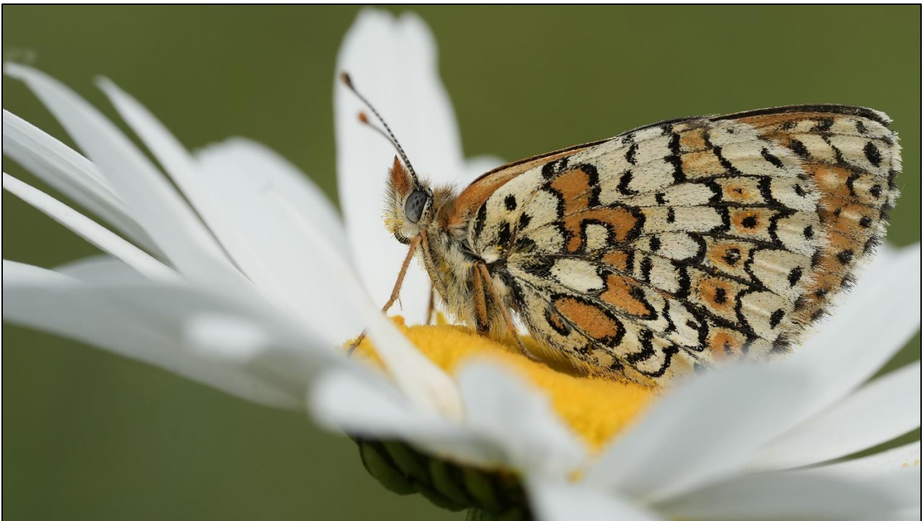
Wegerich-Scheckenfalter (Melitaea cinxia) auf Wiesenmargerite (Leucanthemum vulgare)

So haben wir wie erwartet Mitte Mai die ersten Wegerich-Scheckenfalter ( Melitaea cinxia ) fliegen sehen. Bei einer Zählung am 25. Mai wurden rund 100 dieser wunderschönen Tagfalter gezählt. Damit ist er aktuell der häufigste Schmetterling auf unserer Fläche! Auch eine Eiablage am Spitzwegerich ( Plantage lanceolata ) konnte beobachtet werden. Damit bleibt zu hoffen, dass uns dieser schöne Tagfalter noch lange erhalten bleiben wird.