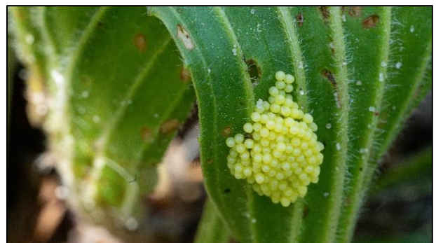
Eier am Spitzwegerich (Plantage lanceolata)