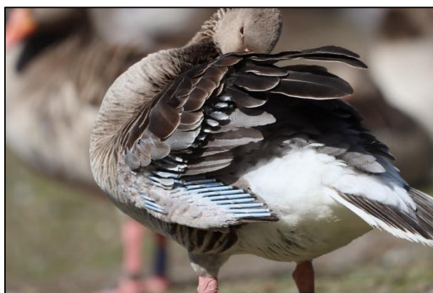
Bei der Mauser sind die blauen Federkiele gut zu sehen

Zwischen Mitte Mai und Mitte Juni mausern die Graugänse und sammeln sich dazu mit vielen Artgenossen auf größeren Gewässern. Da die Gänse während der Mauser rund vier Wochen lang flugunfähig sind, ist dies eine gefährliche Zeit für sie. Sie können nur in Ufernähe grasen, um bei Gefahr schnell zum sicheren Wasser laufen zu können. Graugänse kommen nun von nah und fern nach Hamburg; der Großteil der jetzt anwesenden Gänse sind sozusagen reine „Mauser-Touristen“, welche ab Mitte Juni die Stadt wieder verlassen.