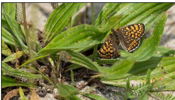
Eiablage am Spitzwegerich (Plantage lanceolata)