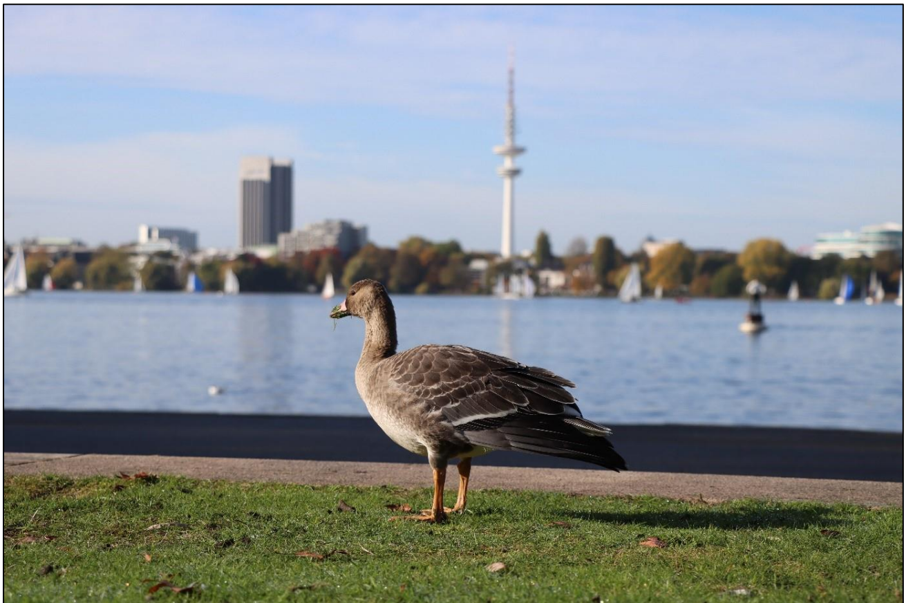
Diesjährige Blässgans ( Anser albifrons ) am Schwanenwik an der Außenalster

Im Oktober ziehen tausende arktische Gänse über Hamburg, häufig entlang der Alster und Elbe. Dabei handelt es sich überwiegend um Weißwangen-, Saat- und Blässgänse.