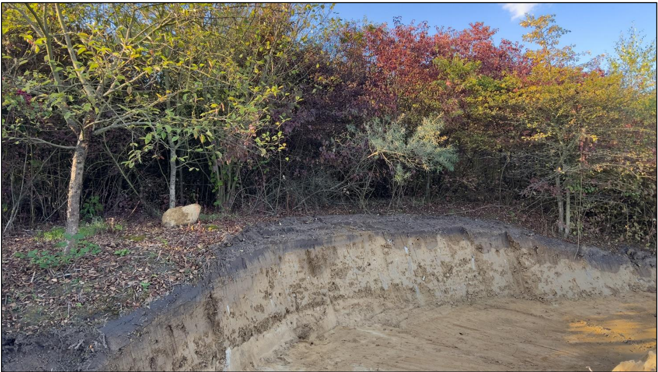
Neu geschaffene Steilwand für Haut- und Netzflügler

Am 06.10. fanden wieder Baggerarbeiten auf der Projektfläche statt, so haben wir wieder eine Basis für einen arbeitsreichen Winter. Unter anderem gibt es nun eine neue Steilwand, mit welcher Haut- und Netzflügler gefördert werden.