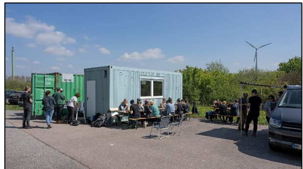
In der Mittagspause gab es leckere Suppe und Schnitten

Das Vegetationswachstum hat nun richtig Fahrt aufgenommen, am 29.04. haben wir eine erste Teilfläche gemäht. Durch die frühe Mahd werden in diesen Bereichen tendenziell Kräuter gefördert und Gräser an der Ausbreitung gehindert.