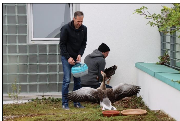
Zuerst wird die Mutter geholt und dann die Gössel (Küken) eingesammelt