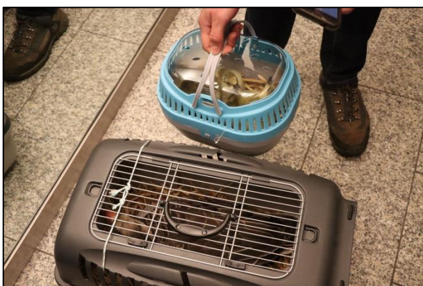
Nicht viele Graugänse können/dürfen Fahrstuhl fahren