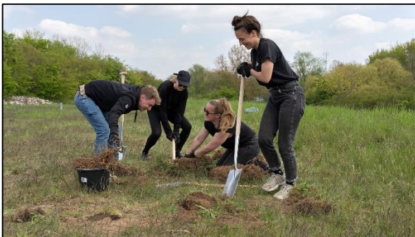
Mit Spaß und Elan bei der Arbeit

Am 28. April wurde die erste gemeinsame Aktion mit dem tatkräftig e. V. durchgeführt, hierbei half uns das Team der Kreativagentur BLOOD Actvertising einen Tag mit 24 Personen bei der Arbeit auf der Projektfläche. Das für solch eine große Gruppe benötigte Werkzeug wurde mit Hilfe der Karl-Kaus-Stiftung finanziert. Neben dem Entfernen von Luzernen wurden auch Weißdorne und Pappeln ausgegraben sowie kleine Wiesenknöpfe entfernt. Ein sehr erfolgreicher, toller Tag mit lauter motivierten Menschen – wir sagen DANKESCHÖN!