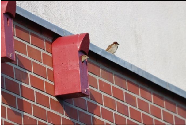
Haussperlingspaar bei der SAGA in Horn

Bereits am 23. April konnten wir die ersten flüggen Haussperlinge in Groß Borstel beobachten. An vielen Nistkästen wird jetzt gefüttert, wodurch man nun sehr gut die belegten Kästen dokumentieren kann.