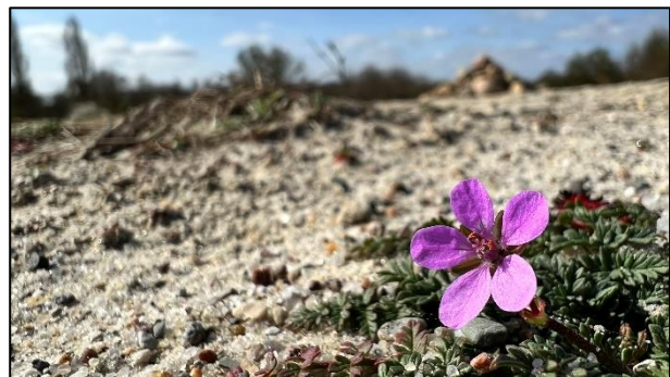
Gew. Reiherschnabel (td)

Sehr gut vorbereitet starten wir in die neue Vegetationsperiode, nicht zuletzt durch fleißige externe Hände konnten wir die letzten dringenden Arbeiten fast erledigen. Nun gilt es am Ball zu bleiben, damit wir neben der ständigen Pflege (Mahd usw.) auch mit der Entwicklung der Fläche vorankommen.