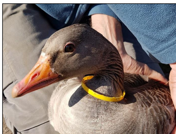
Graugans in Hammerbrook (sk)