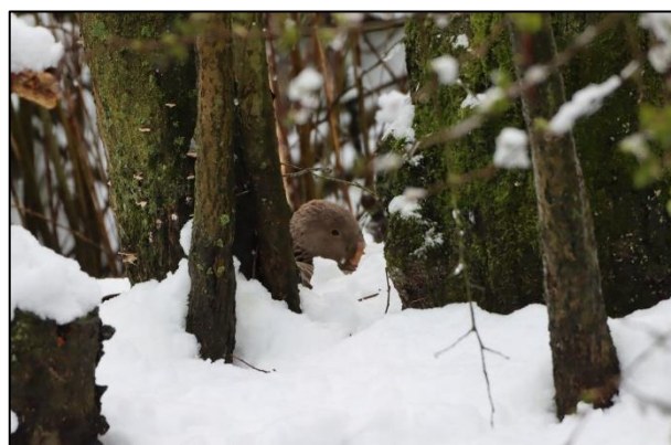
Eingeschneite Graugans auf ihrem Nest in Lokstedt (sh)

Und dann kam doch noch mal der Winter mit 10-15 cm Neuschnee in der Nacht zum 31. März. Die Parks mit ihren kurzrasigen Grünflächen waren komplett zugeschneit. Nahrung fanden die Gänse noch in Bereichen wo das Gras höher steht. Brütende Gänse harhten unter dem Schnee aus, denn während des Schneefalls darf das Gelege nicht verlassen werden. Auch die ersten Gössel hatten nun ein Problem durch die Kälte und den Nahrungsmangel; anhand der Beringung der Eltern können wir die möglichen Verluste dokumentieren