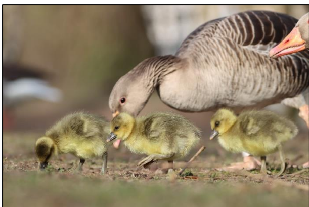
Erste Hamburger Graugansfamilie des Jahres (sh)

Aber längst nicht jede Brut ist erfolgreich, denn beispielsweise kommen Füchse immer häufiger im Stadtgebiet vor. Dadurch kommt es zur Aufgabe von Brutgebieten, beispielsweise in Alsterdorf und Barmbek. Aufgrund fehlender sicherer Brutplätze wie Inseln oder Schilfgürtel, brüten die Gänse entlang der Kanäle meist an (vermeintlich) geschützten Stellen am Ufer.