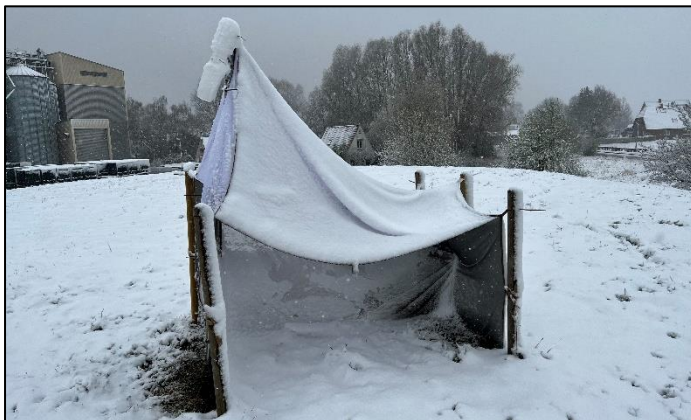
Eingeschneite Malaisefalle (td)

Auch unsere aufgestellten Malaisefallen mussten dem Neuschnee trotzen. Ihre erste Bewährungsprobe für dieses Jahr.