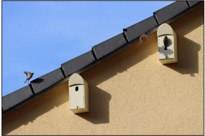
Neue Spatzenquartiere werden bei der SAGA in Groß Borstel von Hausperlingen besichtigt (sh)

Wir starten mit 1.357 Nistkästen in die neue Saison und freuen uns über Meldungen belegter Kästen. Bis Anfang Mai sollen noch 22 Mauerseglernistkästen in Bramfeld und Horn montiert werden