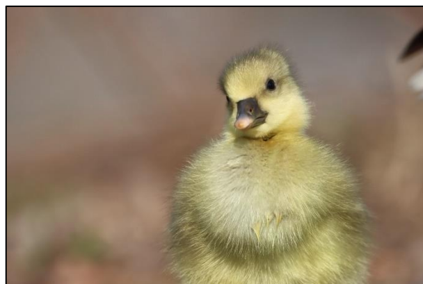
In den ersten Lebenstagen sieht man noch den Eizahn an der Schnabelspitze (sh)

Und dann kam doch noch mal der Winter mit 10-15 cm Neuschnee in der Nacht zum 31. März. Die Parks mit ihren kurzrasigen Grünflächen waren komplett zugeschneit. Nahrung fanden die Gänse noch in Bereichen wo das Gras höher steht. Brütende Gänse harhten unter dem Schnee aus, denn während des Schneefalls darf das Gelege nicht verlassen werden. Auch die ersten Gössel hatten nun ein Problem durch die Kälte und den Nahrungsmangel; anhand der Beringung der Eltern können wir die möglichen Verluste dokumentieren