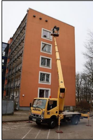
Mauerseglerkästen werden bei der SAGA in Groß Borstel montiert (sh)

Ab Mitte März beginnen viele Hausperlinge mit dem Nestbau. Jetzt beginnt eine spannende Zeit, denn nun sieht man welche Nistkästen bezogen werden und welche noch nicht. Da diese Art aber meist zwei bis drei Mal im Jahr brütet, können noch bis in den Juli hinein Kästen neu bezogen werden.