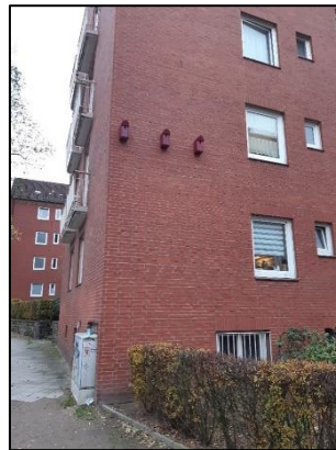
Frisch montierte Spatzenkästen bei der SAGA/Altona(sh)