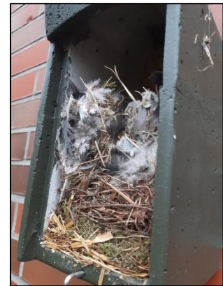
Ein typischer "vollgestopfter" Spatzenkasten (sh)