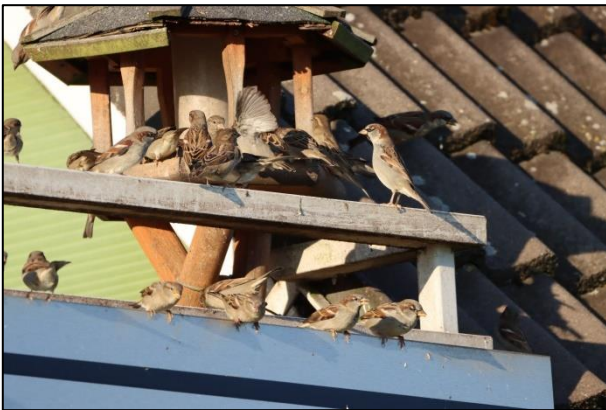
Spatzenschwarm am Futterhaus; mittlerweile ein seltenes Bild in Hamburg (sh)

Unterstützung beim Pflanzen, Montieren und Dokumentieren ist immer herzlich willkommen. Interessierte können sich beim Projektleiter Simon Hinrichs melden: siedlungssaenger@neuntoeter-ev.de