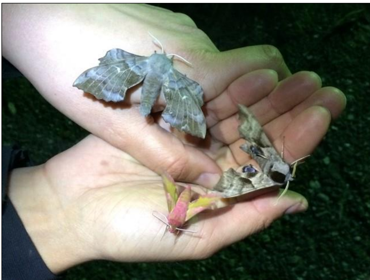
„Die Schönen der Nacht“ (tz)

https://www.ndr.de/fernsehen/sendungen/die_nordreportage/Die-Schoenen-der-Nacht-Nachtfalter,sendung1205780.html