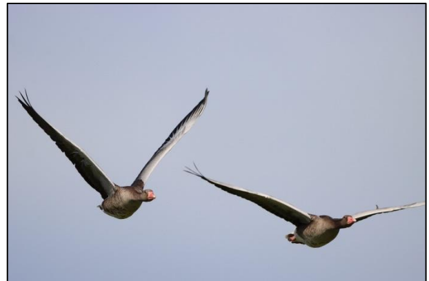
Grauganspaar im Flug in (für uns) unbekannte Gefilde (sh)

Zwar endete dort sein Lebenslauf, aber dies ist ein weiterer wertvoller Hinweis zum Verbleib der Hamburger Graugänse nach der Brutzeit; viele beringte Gänse bleiben nämlich zwischen Juli und Februar verschollen. Seine Partnerin erschien im folgenden Frühling (2020) wieder "zu Hause" in Ohlsdorf, bereits mit einem neuen Partner; wenn Gänse ohne ihren Partner zurückkehren, lebt dieser in den meisten Fällen nicht mehr (Monogamie).