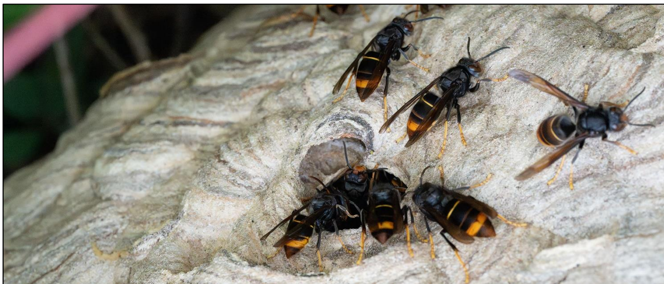
Asiatische Hornisse ( Vespa velutina ) im Hamburger Hafen

Das Programm geht am 01. November abends online: https://www.insektenwoche.de