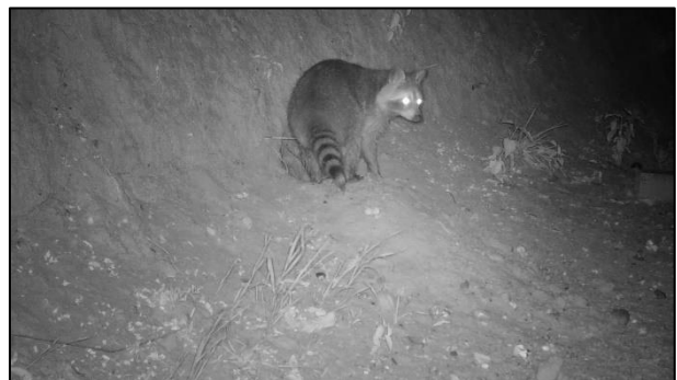
Waschbär ( Procyon lotor )