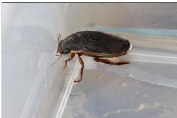
Mittlerer Gelbrand ( Dytiscus dimidiatus )