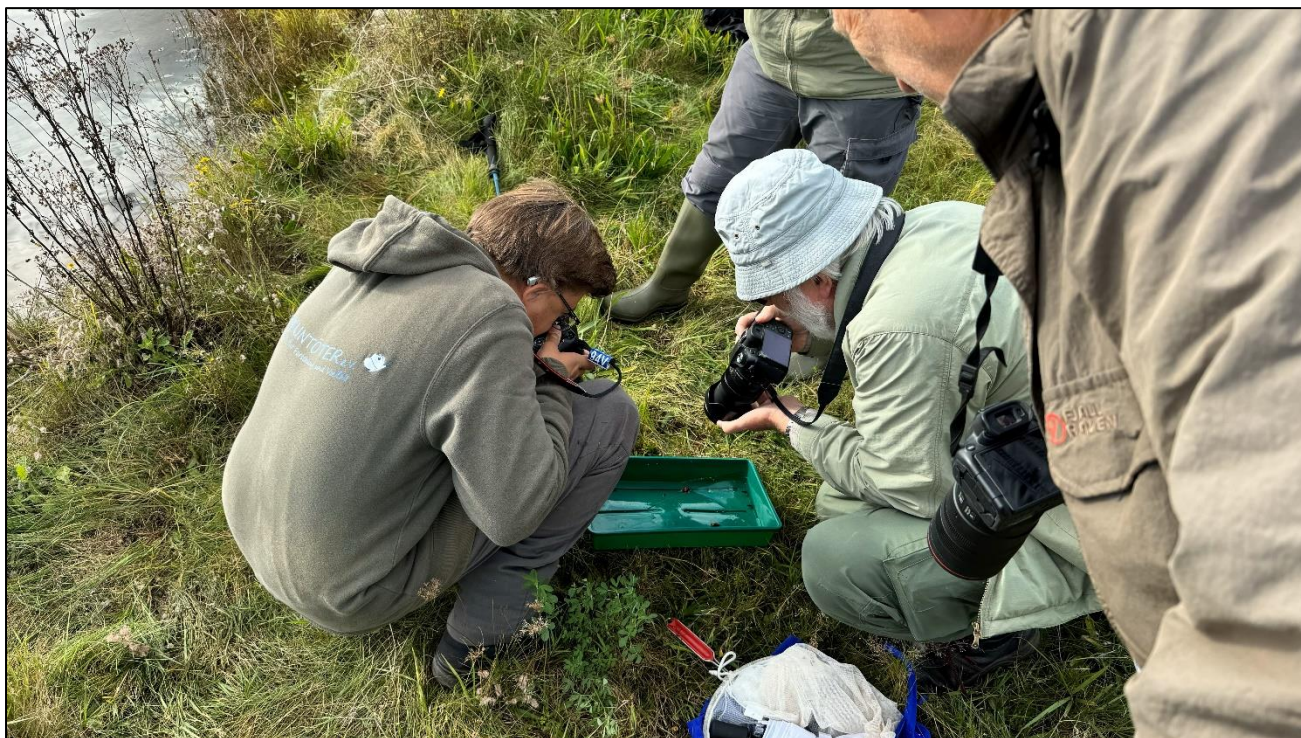
Dokumentation der Funde

Am 08. Oktober bekamen wir Besuch von einigen Aktiven der IG Hemimetabola , die auf der Suche nach Wasserwanzen waren. Spontan schlossen sich ihnen einige von uns an.