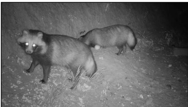
Marderhund ( Nyctereutes procyonoides )

Mehr Infos zum Projekt und Meldeportal: https://www.neobiota-nord.de