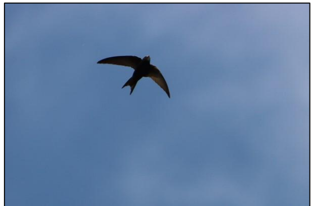
Mauersegler über Rahlstedt

Bis Mitte Mai waren endlich auch die Mauersegler zurückgekehrt. Wir sind sehr gespannt, welche der neuen und alten Nistkästen von ihnen entdeckt und angenommen werden.