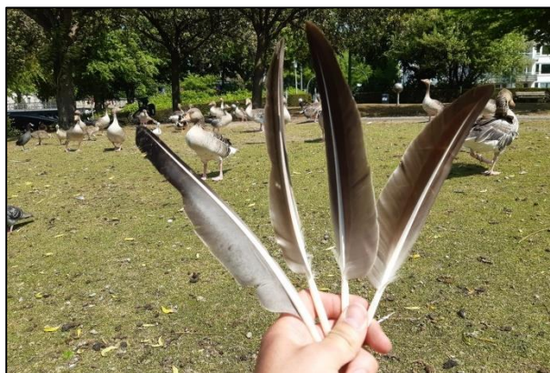
Von Mitte Mai bis Mitte Juni werden die Schwungfedern erneuert

Aufgrund der Mauser müssen die Graugänse die Uferbereiche viel intensiver nutzen als sonst, da sie zur Nahrungssuche ja nicht auf Wiesen und Felder fliegen können. Dies führt jedes Jahr vermehrt zu „Unfällen“ mit Angelschnüren und -haken.