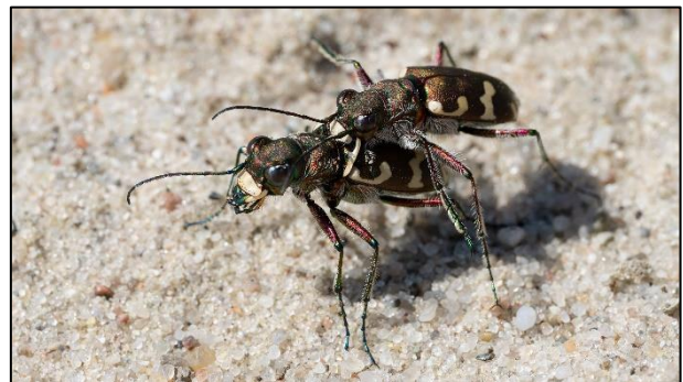
Paarung von Dünen-Sandlaufkäfern

Unsere nächsten geplanten Arbeitseinsätze findet ihr unter Termine!