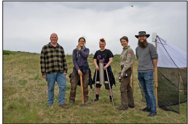
„Team Jordsand“ und Team „Neuntöter“ nach dem Fallenaufbau auf Scharhörn