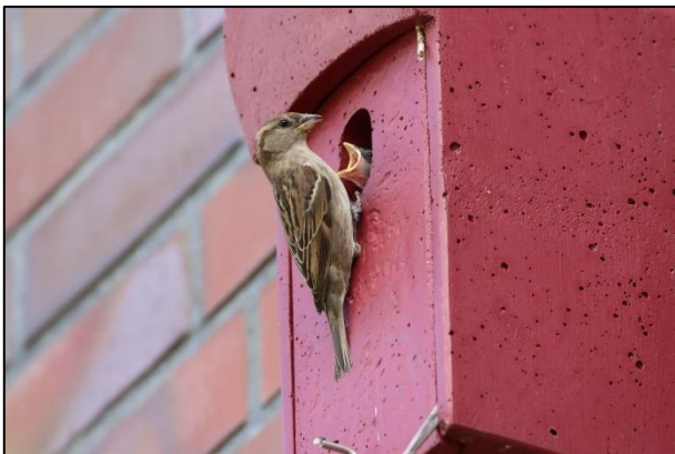
Haussperlingsweibchen füttert Nachwuchs in Rahlstedt

Während die jungen Spatzen aus den Erstbruten längst selbständig sind, brüten viele Haussperlinge bereits ein zweites Mal. Wir freuen uns weiterhin über Meldungen besetzter und unbesetzter Kästen, jeder Nistkasten hat eine „Hausnummer“ auf der Unterseite: siedlungssaenger@neuntoeter-ev.de