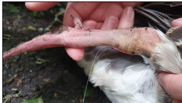
Angelhaken steckt im Bein einer Graugansmutter am Kuhmühlenteich

In den letzten Wochen mussten wir wieder mehrere Graugänse befreien, nicht alle überleben dies, vor allem wenn Haken verschluckt werden.