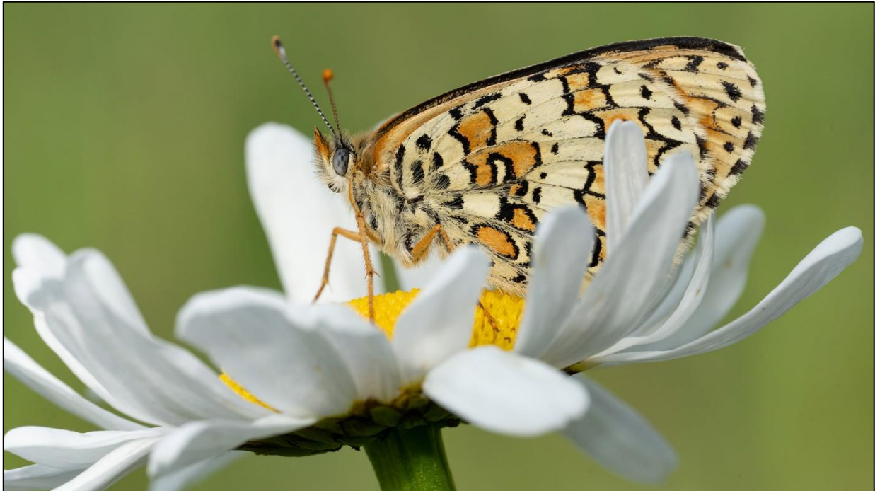
Wegerich-Scheckenfalter auf Wiesen-Margerite

Im Mai zeigten sich die Erfolge unseres Wirkens auf der Projektfläche in verschiedenster Weise. So konnte z. B. der Wegerich-Scheckenfalter das vierte Jahr in Folge nachgewiesen werden. Erste adulte Exemplare zeigten sich am 14. Mai, am 16. konnten dann mind. 18 Exemplare gezählt werden, wobei auch Paarungsverhalten beobachtet wurde.